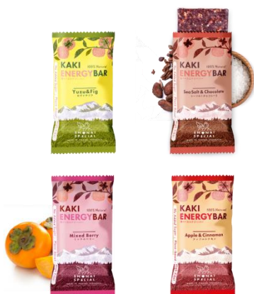
KAKI ENERGY BAR (柿ベースエナジーバー)