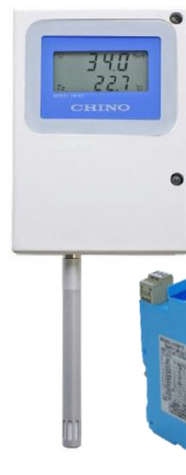
壁取付形温湿度計 (本質安全防爆構造) HN-E8シリーズ