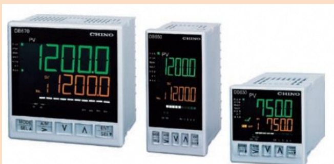
デジタル指示調節計 DB600シリーズ Digital Indicating Controllers, DB600 series