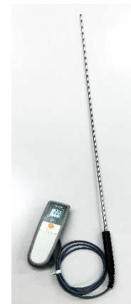
醸造用温度計 MFシリーズ