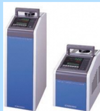
低温用小形校正装置 KT-H503, KT-H504 Small Type Low Temperature Calibration Equipment, KT-H503, KT-H504