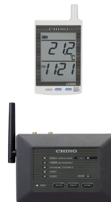
リアルタイム 無線ロガー MZシリーズ