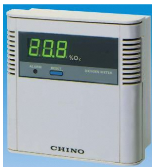
酸素濃度計 MGシリーズ