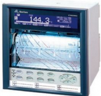
ハイブリッドメモリーレコーダ AL4000シリーズ Hybrid Memory Recorders, AL4000 series