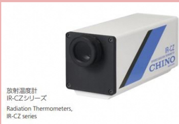
放射温度計 IR-CZシリーズ Radiation Thermometers, IR-CZ series