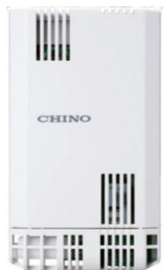
壁取付形温湿度計 HN-EKシリーズ