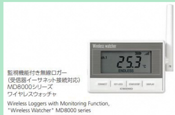
監視機能付き無線ロガー (受信器イーサネット接続対応) MD8000シリーズ ワイヤレスウォッチャ Wireless Loggers with Monitoring Function, "Wireless Watcher" MD8000 series