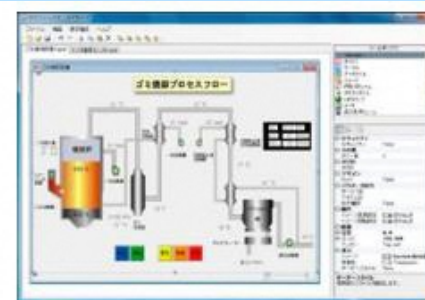
集録・監視パッケージシステム CISAS/V4 Data Acquisition and Monitoring Package System, CISAS/V4