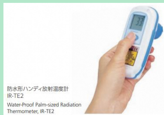
防水形ハンディ放射温度計 IR-TE2 Water-Proof Palm-sized Radiation Thermometer, IR-TE2