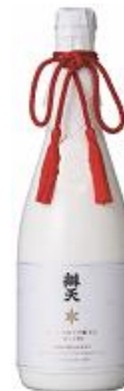
合資会社後藤酒造店

山形のオリジナル酒米「雪女神」を28%まで磨き上げ、芳醇な香りとスッキリとした透明感のある飲み口が特徴の純米大吟醸酒の逸品です。