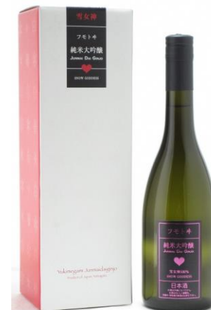
麓井酒造株式会社

フランスに「シャトー・カロン・セギュール」とい うハートマークのラベルで有名な赤ワインがありま す。見た目とは対照的なゴツイフルボディのワイン でそのギャップに惹かれファンになりました。さて 当社の「雪女神」、酒米の名称そのままのネーミン グとハートマークのラベルはいかにも安直と言われ そうですが、吟醸酒としてはクラシックなマスカッ ト様の香り、やや酸味強、甘さ控えめというちょっ と硬派（社内比）なお酒を詰めました。カロンへの オマージュと言ったらかっこつけすぎでしょうか。 女神を35%精米した純米大吟醸酒です。果実様の香 りがあり、やわらかく綺麗で上品な味わいは雪女神 ならではの。