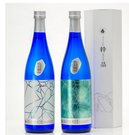
千代寿虎屋株式会社

弊社と深いつながりのある地元酒米耕作者が、春先の育苗から生育管理を徹底して栽培した新酒造好適米「雪女神」を用いています。自家精米を行った上で、水分管理に気を使って酒米を管理し、厳寒の1月に手間暇をかけて丁寧に仕込みを行いました。芳醇な吟醸香と馥郁とした透明感のある上品な味わいの純米大吟醸になっております。ネーミングとデザインは東北芸術工科大学との共創プロジェクトです。