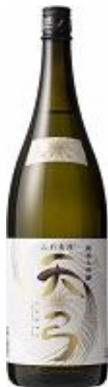
東の麓酒造有限会社

天弓シリーズの大吟醸 暁天、純米大吟醸 藍天に使用しています。スッキリとした酒質ですが米の旨味も感じられる人気の商品です。