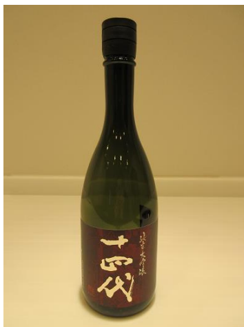
高木酒造株式会社

雪女神35%磨。山形酵母を使用し、長期低温発酵によるフレッシュで心地良い吟醸香が魅力。 瑞々しく絹のような柔らかな喉ごしの限定醸造酒。