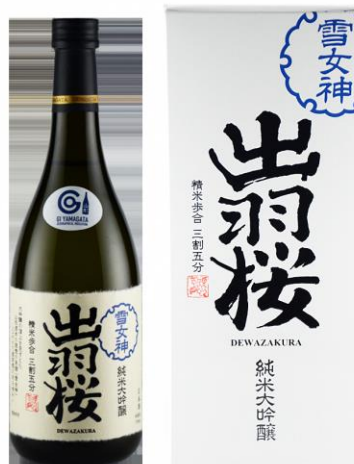
出羽桜酒造株式会社

大吟醸の頂点を見すえた山形酒米の理想の系譜「雪女神」。 その酒米を惜しみなく、35%まで磨いた出羽桜至高の1本。 美しい香りと広がる余韻に心ひかれる、しなやかで透明感のある味わいをお楽しみください。