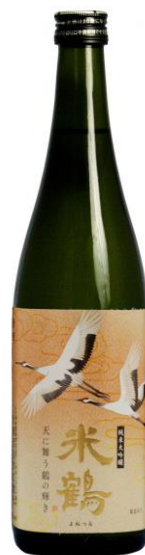
米鶴酒造株式会社

雪女神を35%精米し、全工程手造りによる鑑評会レベルの純米大吟醸酒です。果実様の香りがあり、やわらかく綺麗で上品な味わいは雪女神ならでは。