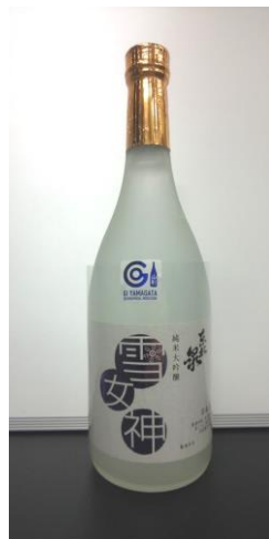
合資会社高橋酒造店

出羽富士と称される鳥海山の伏流水 を使用し、その名のとおり柔らかで 透明感のある精米歩合40%の純米大 吟醸です。