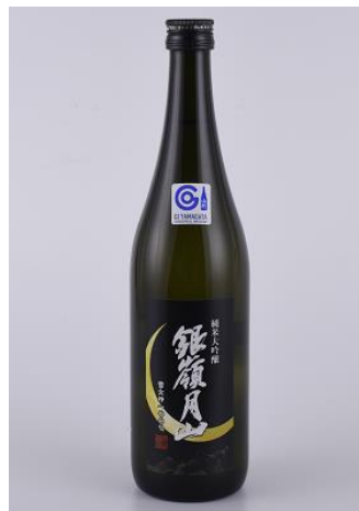
月山酒造株式会社

兵庫県産山田錦を用いて製造している大吟醸の酒米を、山形県酒造好適米「雪女神」に変え、培ってきた技術をより前にすすめ醸した純米大吟醸です。ボリューム感のある華やかな香りと、美しく澄んだ喉越しはお料理との相性抜群です。澄んだ清涼感のバランスも良く、繊細で上品な酒質となっています。