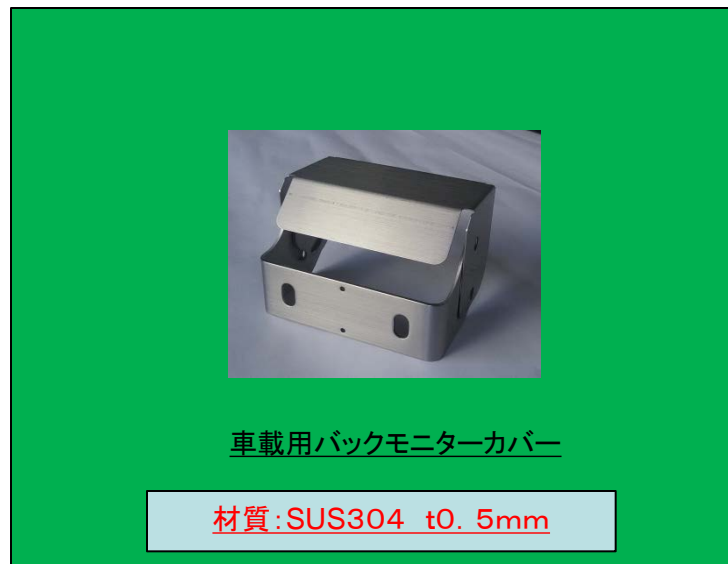
車載用バックモニターカバー