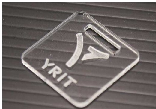
【加工例】工業技術センターのロゴの彫刻